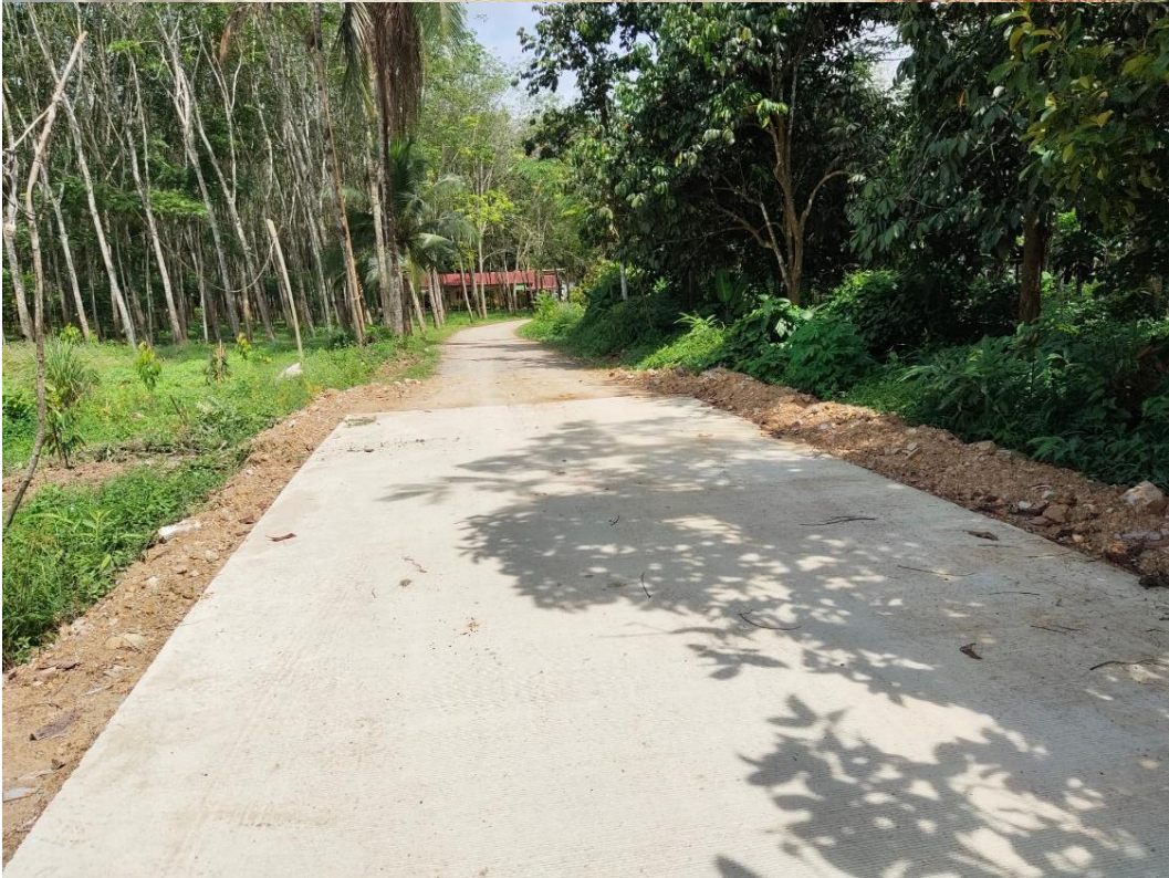
ภาพถ่ายโครงการก่อสร้างถนนคอนกรีตเสริมเหล็ก ถนนสายห้วยพอ-บ้านนา หมู่ที่ 9