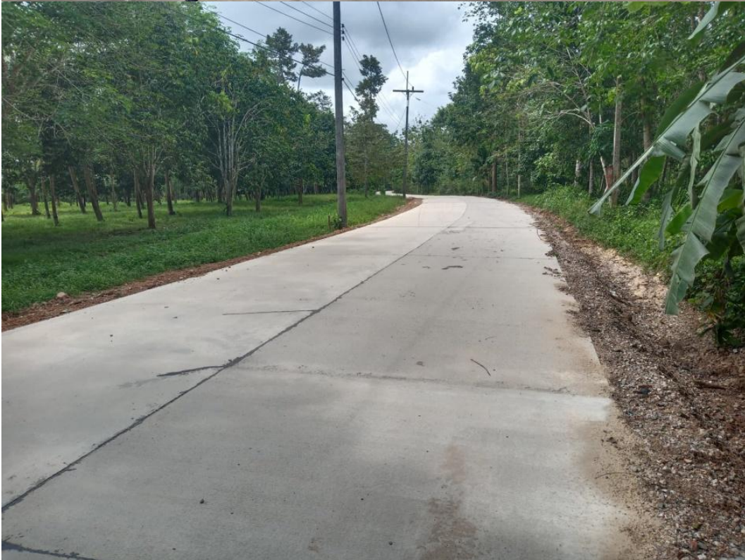
ภาพถ่ายโครงการก่อสร้างถนนคอนกรีตเสริมเหล็ก ถนนสายห้วยพอ-นาแคไปะเลียบ หมู่ที่ 9