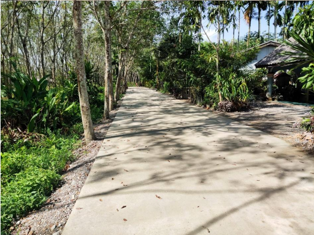
ภาพถ่ายโครงการก่อสร้างถนนคอนกรีตเสริมเหล็ก ถนนสายทางทราย หมู่ที่ 2